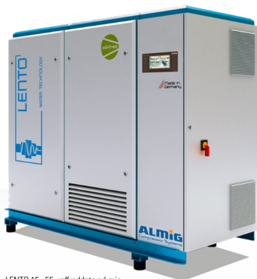
LENTO 15 - 55, raffreddato ad aria