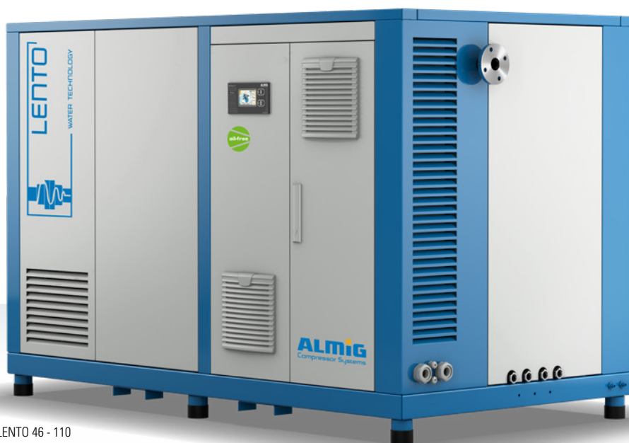
LENTO 46 - 110