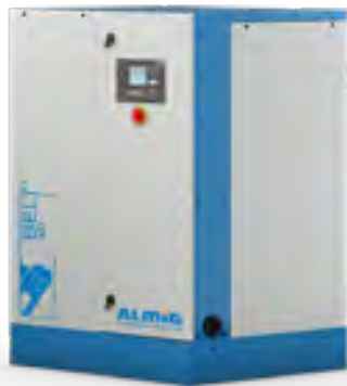
BELT XP 4-6