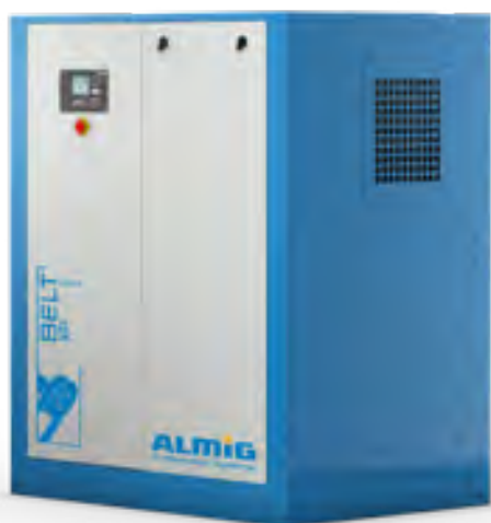
BELT XP 16-22