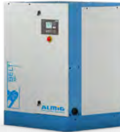
BELT XP 8-15