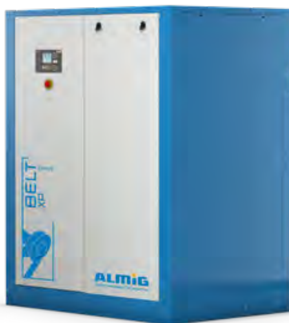
BELT XP 30-37