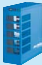
ADD 310 als Stand-alone-Version