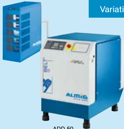
ADD 50 Wandmontage