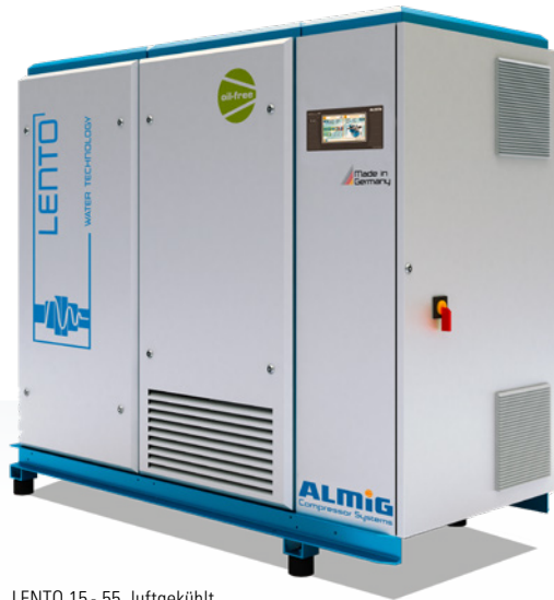
LENTO 15 - 55, luftgekühlt