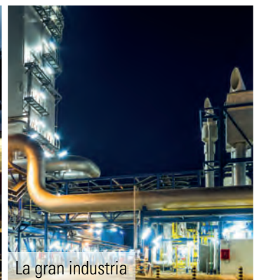
La gran industria