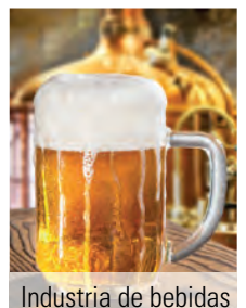
Industria de bebidas