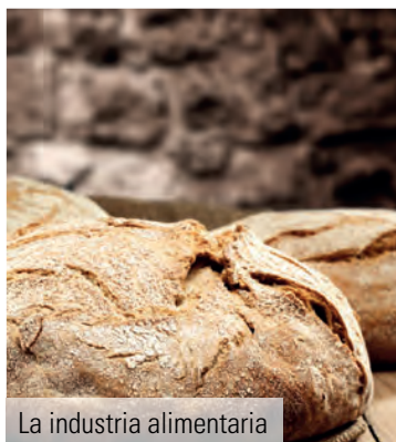
La industria alimentaria